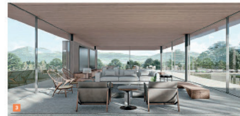
3 As áreas sociais ficam no nível inferior, incluindo a sala de estar com acesso à piscina