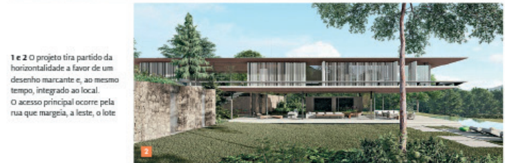
1 e 2 O projeto tira partido da horizontalidade a favor de um desenho marcante e, ao mesmo tempo, integrado ao local. O acesso principal ocorre pela rua que margeia, a leste, o lote