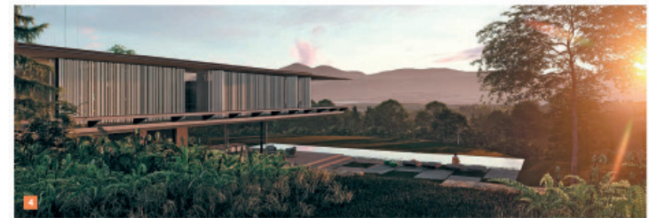
4 Para assegurar conforto térmico, a implantação buscou as melhores condições de insolação da fachada sul. A piscina foi orientada perpendicularmente em relação à casa