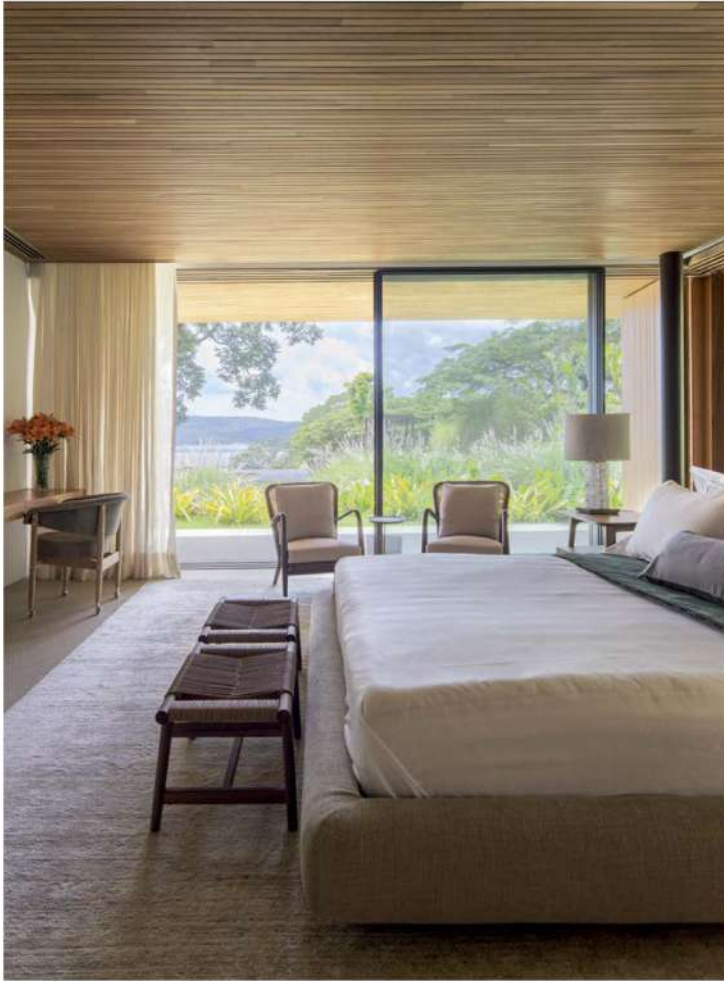
Acima, a paisagem natural invade o quarto do casal, que soma cama estofada Dream Bed, de Marcel Wanders para a Poliform, banquetas Giano e duas poltronas Agave, da Flexform, tudo da Casual Móveis. Na pág. seguinte, jardim concebido por Rodrigo Oliveira