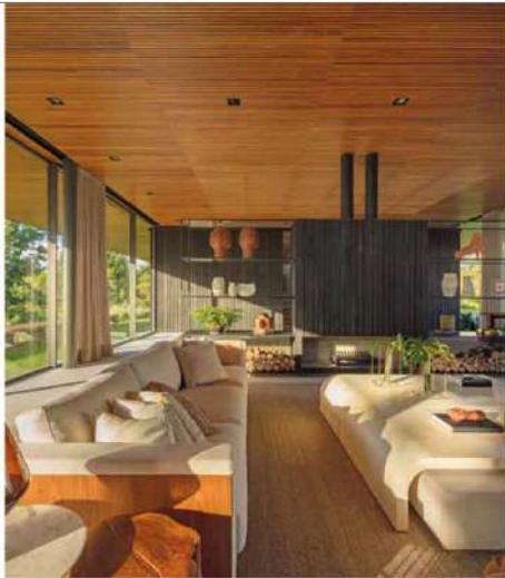
Amba se puede ver la librería y la chimenea diseñadas por Jacobsen Arquitetura y Marcela Emani. Para revestir el frontal de la chimenea se ha utilizado la misma madera carbonizada de los cerramientos exteriores. Piezas de artesanía, de Artes do Imaginário Brasileiro.